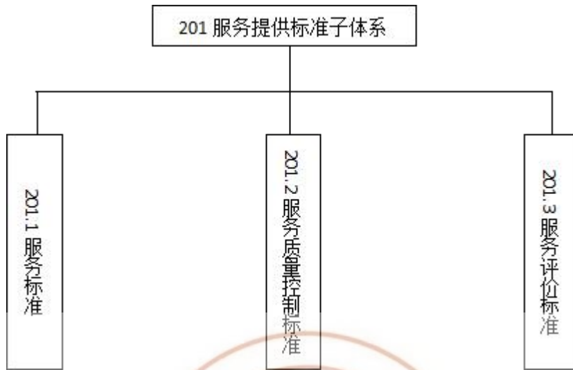
图3 服务提供标准子体系结构图