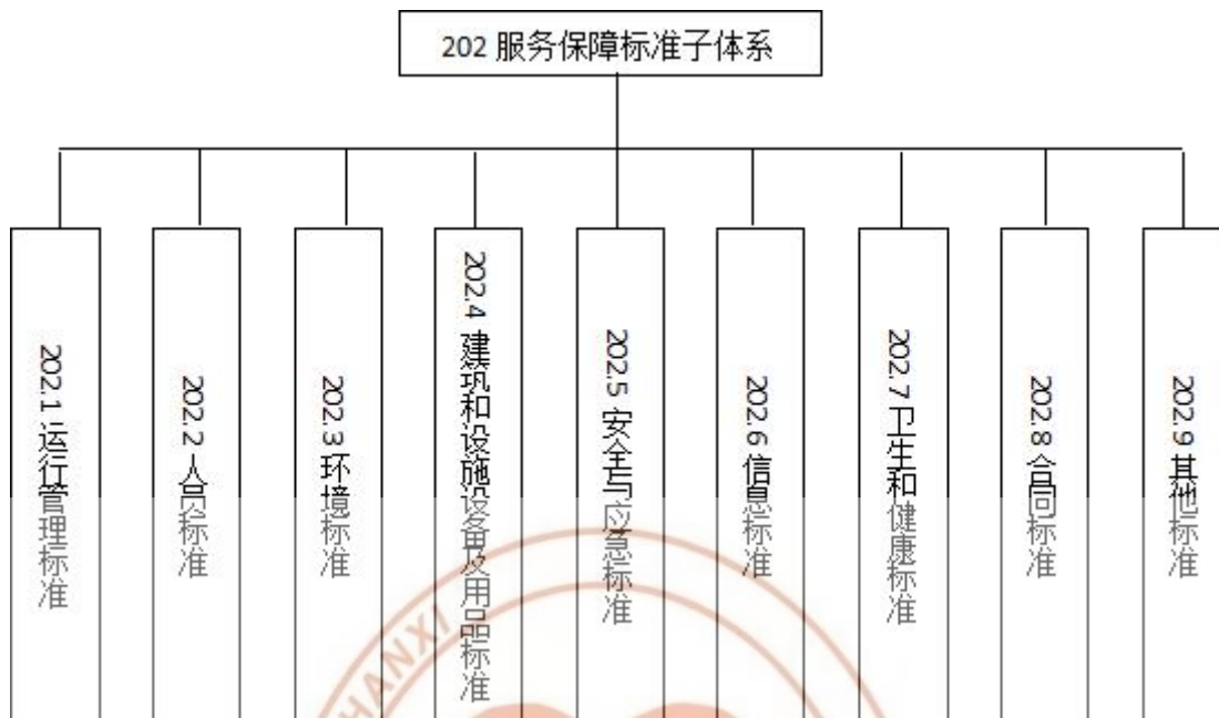
图4 服务保障标准子体系结构图